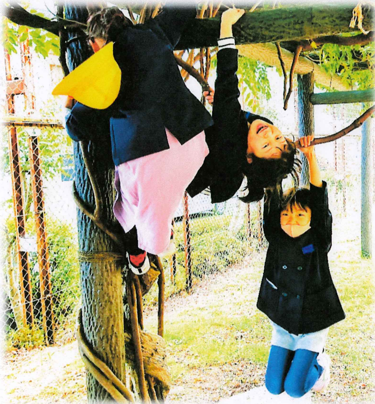
ふじ棚も遊び場に...